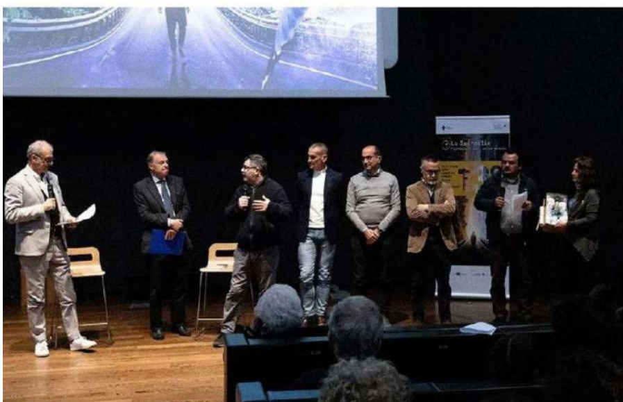
Un momento dell'edizione 2023