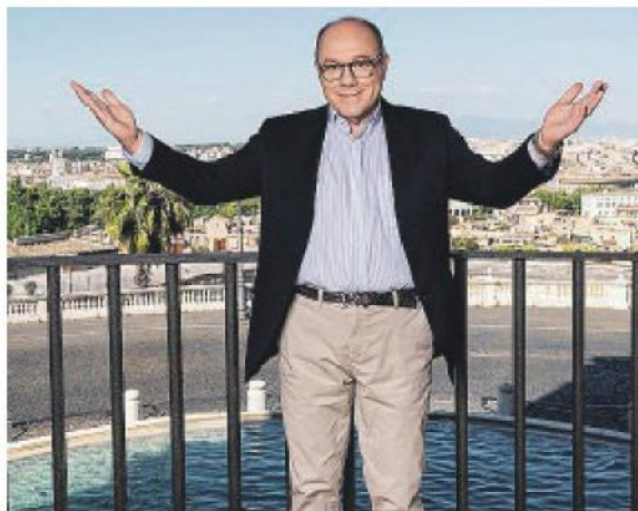
SUPER OSPITE Carlo Verdone a «MovieMag» oggi alle 23