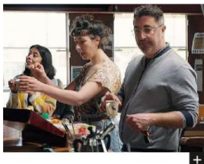
Una scena di Sull'Adamant – Dove l'impossibile diventa possibile (2023)

Capitale e dal Dipartimento Salute Mentale della ASL Roma 1 in collaborazione con il MAXXI, la rassegna gratuita presenta otto corti e otto lungometraggi in concorso. Tra questi Vite sottili di Maite Carpio: adolescenti e anoressia nella storia di tre famiglie e il loro percorso di cura all'Ospedale Pediatrico Bambino Gesù di Roma e Sull'Adamant – Dove l'impossibile diventa possibile di Nicolas Philibert, Orso d'Oro al Festival di Berlino nel 2023, che racconta un centro diurno unico nel suo genere, un edificio galleggiante costruito sulla Senna, nel cuore di Parigi, che accoglie adulti affetti da disturbi mentali. Tanti gli ospiti del festival, da Micaela Ramazzotti e Matteo Garrone al "nostro" Vittorio Lingiardi, protagonista di un incontro con il pubblico l'11 aprile alle 16. (A.C.)