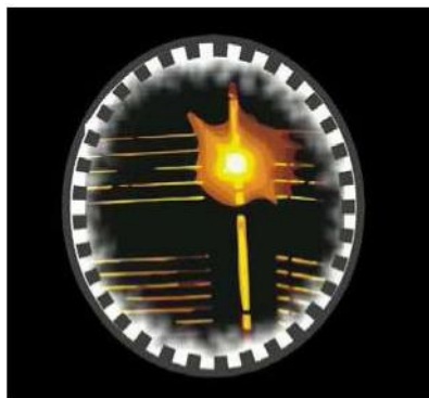
Il logo della manifestazione

iniziare a parlare di salute mentale. È solo dopo aver consentito la piena immedesimazione dello spettatore nella vicenda che è possibile scoprire cosa significhi vivere nella condizione dei protagonisti. Menzione speciale per Miranda's Mind di Maddalena Crespi, per come la regista ha narrato il confine sottile tra realtà e immaginazione, condensando attraverso un racconto per immagini di grande raffinatezza tutta la forza dirompente di una mente creativa alla ricerca di se stessa. Il Premio "Jorge Garcia Badaracco - Fondazione Maria Elisa Mitre" di 1.000 euro al miglior lungometraggio è stato assegnato ad Anna di Marco Amenta, Il Premio SAMIFO di 1.000 euro assegnato da una giuria dedicata, ha decretato che il film che meglio ha raffigurato gli aspetti legati alla transculturalità e alla vulnerabilità delle persone migranti è stato Transcendence: A Journey of Hope and Healing di Jane C. Wagner e Tina di Felicianonio. Menzione speciale per My name is Aseman di Ali Asgari e Gianluca Mangiasciutti,