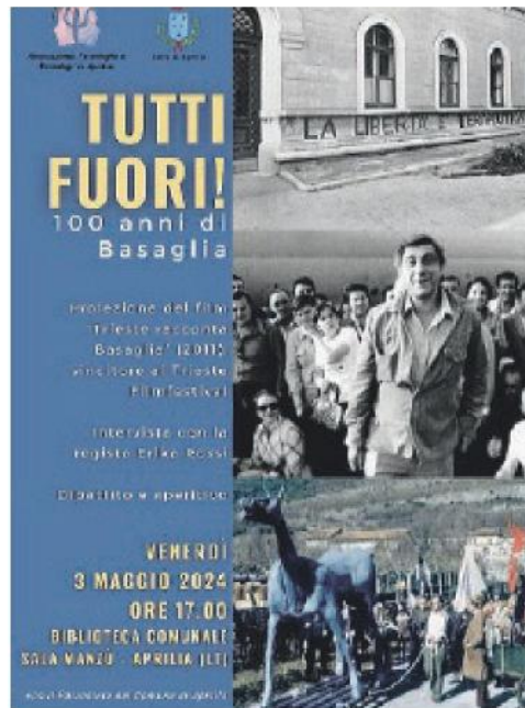
La locandina dell'evento

Ritaglio Stampa ad uso esclusivo del destinatario. Non riproducibile