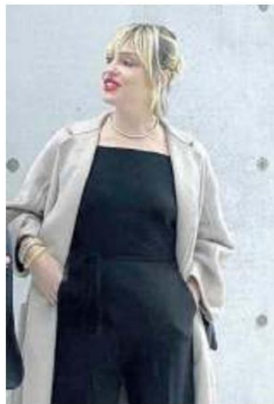
Sopra, la regista e attrice Micaela Ramazzotti alla serata al Maxxi